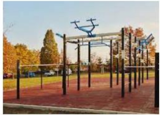
Mit einem Calisthenics Park die Fitness tr... freisport.de