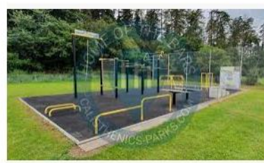
Calisthenics Gym - Haag im OB - Calisthenics Par... calisthenics-parks.com