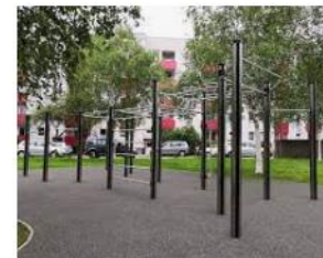
Calisthenics-Park Magdeburg - Trimm... trimm-dich-pfad.com