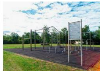
Mit Calisthenics-Parks voll im Trend - Spor... sportplatzwelt.de