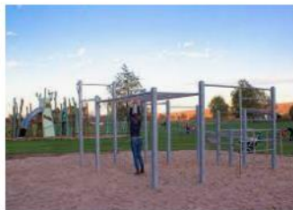
Calisthenics-Park – LEADER-Region Kulturl... leader-in-hx.eu