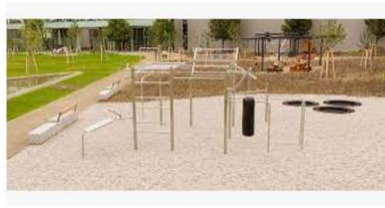
Mit einem Calisthenics Park die Fitness trainieren | FREIS... freisport.de