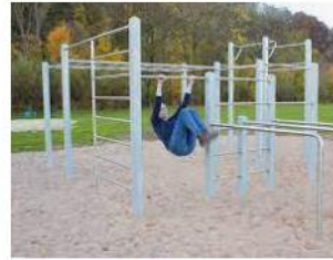
Calisthenics-Park – LEADER-Region K... leader-in-hx.eu