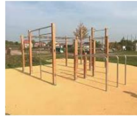
Calisthenics | Playparc playparc.de