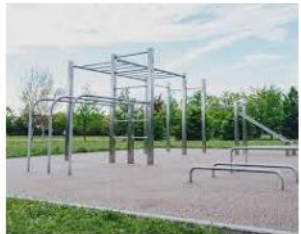
Calisthenics Parks für Städte, Schulen... custombars.de