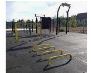
Calisthenics-Park Bexbach tv-oberbexbach.de