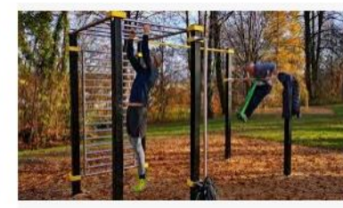
Workout Park Kempten - Home | Facebook facebook.com