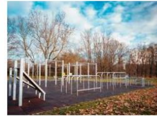
Größter Calisthenics Park in Deutschland... custombars.de