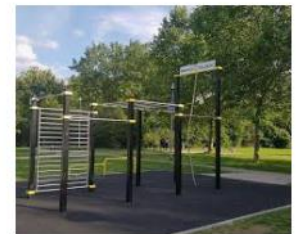
Ingolstadt Sportpark – Barzflex barzflex.com