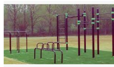
Neuer Calisthenics Park in Bühl secure.avaaaz.org