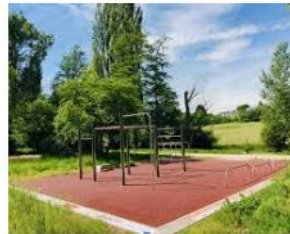
Calisthenics Park bauen - Die ultimati... calisthenics-magazin.de