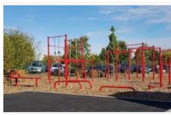
Calisthenics-Park – Calisthenics sc-potsdam.de