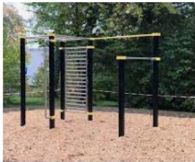
Kempten Fitnesspark – Barzflex barzflex.com