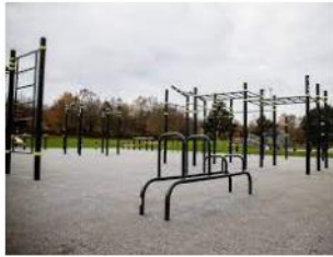
Calisthenics Parks – DCSV dcs-verband.de