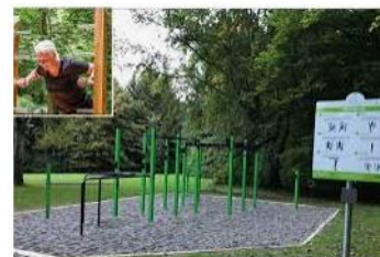
Das Glanzstück des Fitness-Parcours auf der ... allgaeuer-zeitung.de