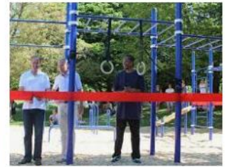
Calisthenics Park Ravensburg kengurupro.de