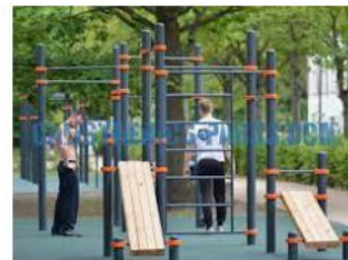
Berlin - Calisthenics Park - Kenguru.PRO ... calisthenics-parks.com